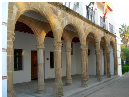
Antigua sede de la Santa Inquisición de Llerena

Los principales objetivos de la Inquisición de Llerena fueron los moriscos y los judíos. Estos suponían un importante filón económico, pues a los reos condenados se les confiscaban sus bienes, se les quitaban sus haciendas, casas, tierras, así como el dinero que tuvieran. Así, el Santo Tribunal por un lado no dejaba que fraguasen otras orientaciones religiosas, a la vez que, con la usurpación de los bienes de los reos, aumentaba sus ganancias el fisco real y el propio tribunal. Pero, por otro lado, el tribunal también perseguía a las brujas y hechiceras. Tras la expulsión de los judíos y de los moriscos, la lupa inquisitorial se puso sobre este tipo de herejías y aumentó drásticamente su presión sobre ellas.